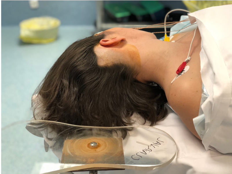
RASAGE ET POSITION DE LA TABLETTE

Névrалgie – Chirurgie de décompression / débouclage